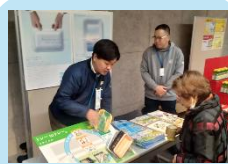
株式会社 エフピコ様