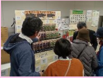
太子食品工業 株式会社様