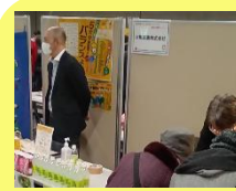
大塚製薬 株式会社様