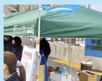
小川原湖 漁業協同組合様