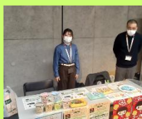
日本生活 協同組合 連合会様