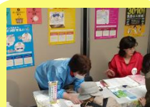
青森県環境 パートナーシップ センター様