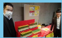
ポッカサッポロ フード&ビバレッジ 株式会社様