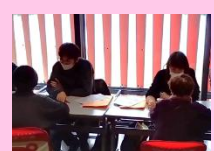
青森県医師会 健やか力推進 センター様