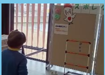
青森保健生活 協同組合様