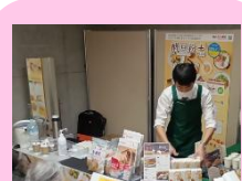
伊那食品工業 株式会社様