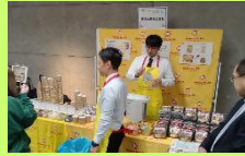
東洋水産 株式会社様