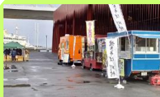
キッチンカーの 皆様