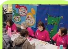
青森市食生活 改善推進会様