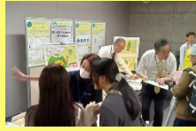
農林水産省 東北農政局 青森県拠点様