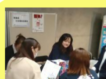
青森県社会福祉 協議会様