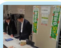
カゴメ 株式会社様