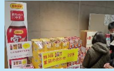
日本食研 株式会社様