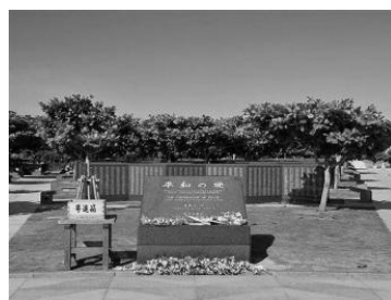
●沖縄地上戦で亡くなられた23万人あまりの名前が刻まれる「平和の礎」