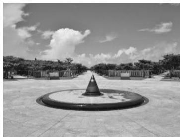
●平和の礎のある広場中央にある「平和の火」