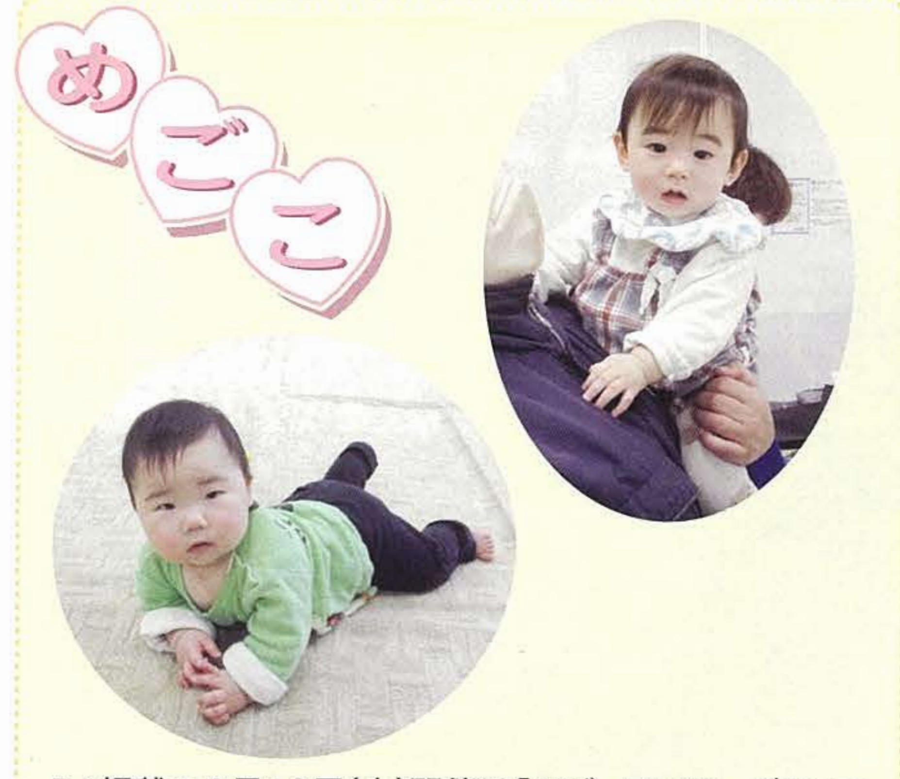
P4掲載の2月13日(木)開催の「ベビーマッサージ」にて