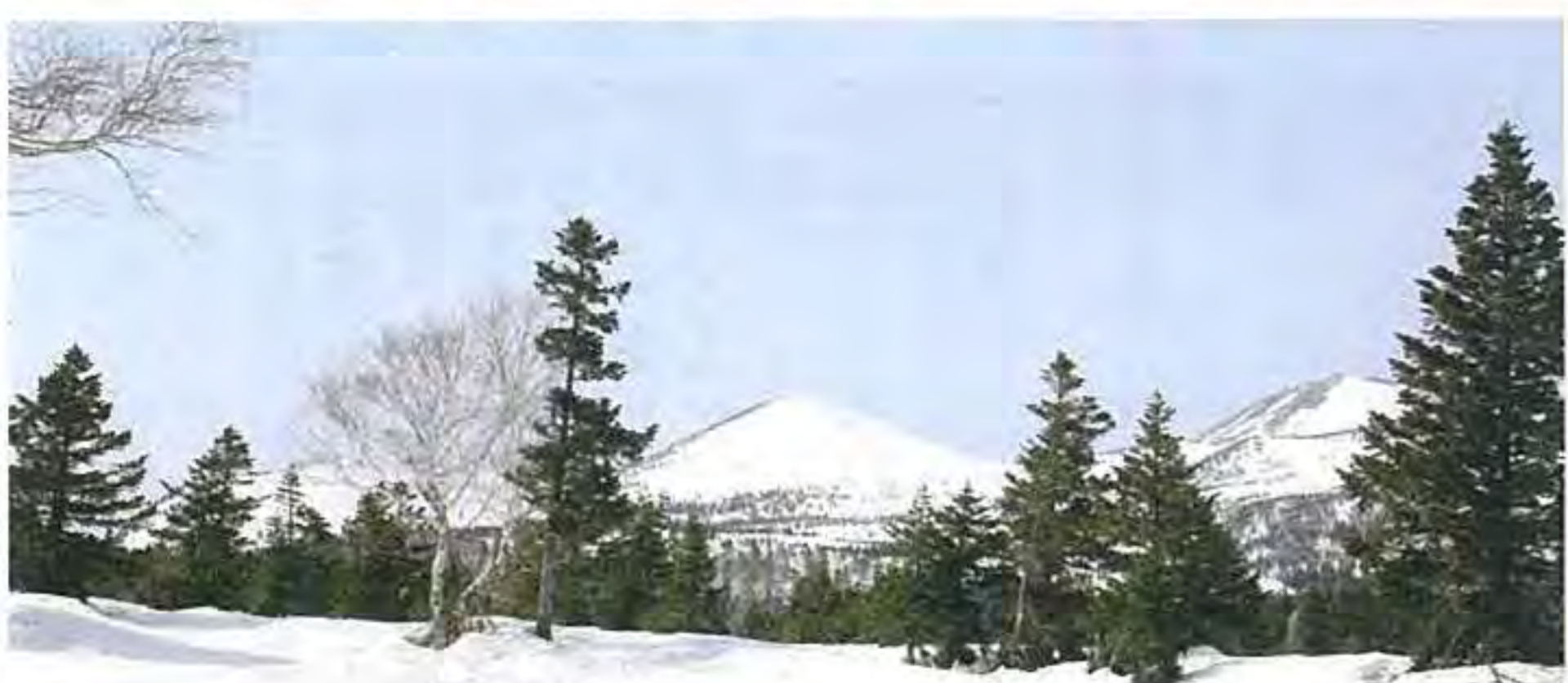
登れるくらい低い場所がありました。雪で低木が埋まり他の時期とは違った風景を見ることができるとも思えます。(左から硫黄岳、大岳、小岳)