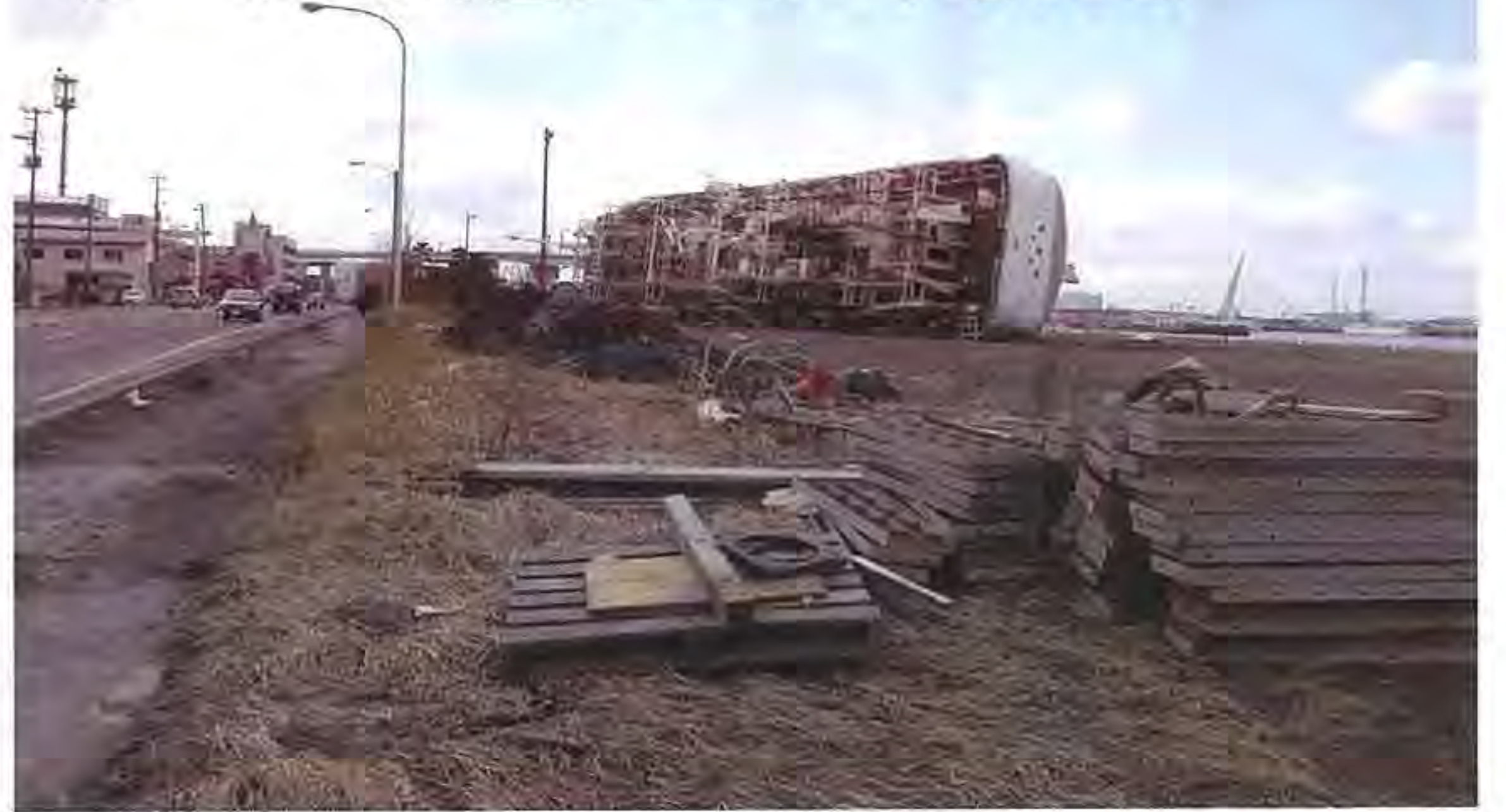
▲東日本大震災発生から数日経過した八戸市の館鼻漁港、倒れている船が地震・津波の恐ろしさを物語っています。

2011年3月11日に東日本大震災が発生し、早くも14年が経過しようとしています。東日本大震災以降も日本各地で地震以外にも様々な災害がありました。昨年は能登半島が地震により甚大な被害をうけ、同地域では9月に豪雨災害に見舞われています。また、西日本では、最大震度6弱を記録した豊後水道地震や日向灘地震が発生しています。特に日向灘地震では、南海トラフ巨大地震との関連から調査情報が出されるなど、大地震への危機感が高まりました。また、2023年に引き続き発生した猛暑が全世界的に猛威を振るいました。 災害に対する意識は年々高まっております。コロナあおりでは、年3回行われる「つどい」の学習テーマとして、災害備蓄に関する考え方やローリングストック、自宅近くの河川や地形、最寄りの避難場所へつづくまでのくわいかかるかなどを事前に把握しておく「マイ・タイムライン」について情報発信を行いました。また、能登半