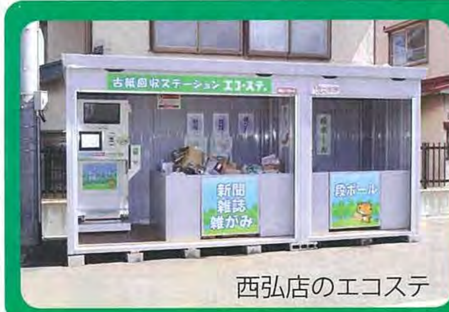
西弘店のエコステ

取り組みは、1月21日~2月20日まで取組まれ、1キロ当たり2円を青森県社会福祉協議会を通じて子ども食堂に送ります。