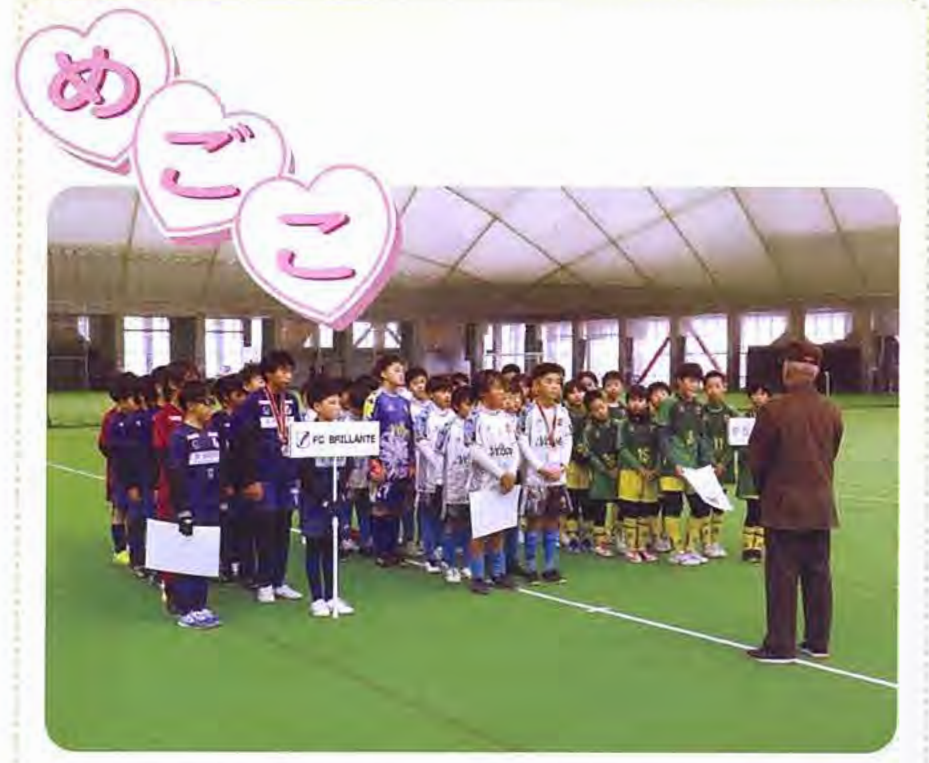
コープ杯争奪サッカー大会出場選手のみなさん。