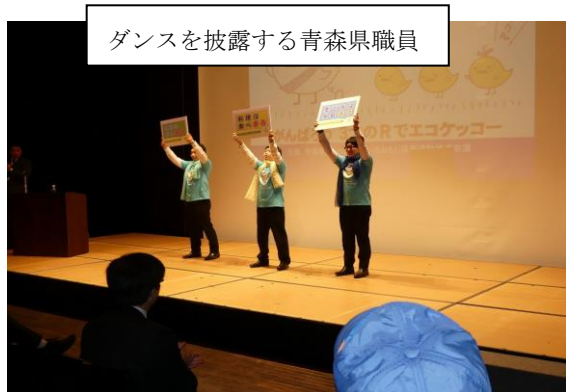
ダンスを披露する青森県職員