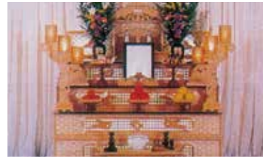
はまなすコース 税込価格 473,000円