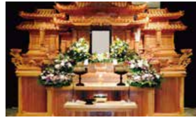
しらゆりコース 税込価格 693,000円