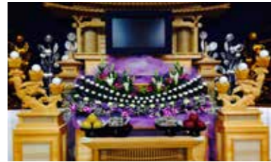
あじさいコース 税込価格 583,000円